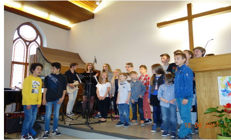
Le culte de Pâques

Le petit déjeuner de Pâques : Dans la joie du Christ ressuscité, nous avons commencé ce dimanche pascal par un temps de convivialité. Environ 100 participants se sont retrouvés autour d'une longue rangée de tables joliment dressées et décorées (petits bouquets de fleurs champêtres et œufs au chocolat pour partager tant de bonnes choses : pain, brioches, kouglofs, beurre, confitures, miel, thé, tisane, café, chocolat chaud... Merci à tous les organisateurs et participants pour la réussite de ce petit-déjeuner de Pâques.