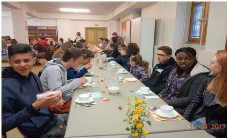
Le petit déjeuner de Pâques